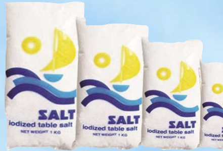
Mfano wa chumvi yenye Iodine

Matibabu mazuri ya Goita ni upasuaji na kuutoa uvimbe. Wagojwa waliokuwa na Goita zinazozalisha sana T3 na T4 au kuzalisha kidogo T3 na T4 hupewa dawa mpaka pale hali ya T3 na T4 zitakaporudi kwenye hali ya kawaida ndipo hufanyiwa upasuaji